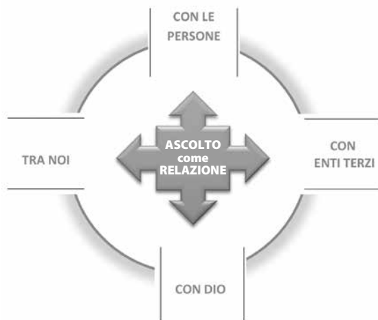
FIG. 1 – Rappresentazione dell'ASCOLTO emersa dal focus group e utilizzata come mappa del percorso formativo

L'analisi degli esiti del focus group ha restituito l'ascolto innanzitutto come RELAZIONE, che si specifica nel rapporto con quattro interlocutori: CON LE PERSONE; TRA NOI; CON ENTI TERZI; CON DIO.